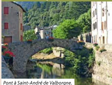
Pont à Saint-André de Valborgne.

À Valleraugue, dans les Cévennes, on trouve le sentier des 4000 marches, magnifique ascension du Mont Aigoual. Lors des graves intempéries du 19 septembre, j'ai pensé très fort à ces lieux, ces habitants, ces communautés bien plus fragiles encore que nos paroisses de l'Alsace rurale. Au moment où j'écris ces lignes, je n'ai pas encore de nouvelles précises quant aux dommages subis par les temples et bâtiments de nos frères et sœurs cévenols. Je veillerai à vous les communiquer le moment venu. Mais voici une pensée à ce sujet. Si les phénomènes climatiques extrêmes s'aggravent progressivement, d'année en année, ils ne sont pas au bout de leur peine ! Les 4000 marches ne sont-elles pas un symbole de ce chemin que nous avons du mal à engager, pour limiter enfin et durablement l'émission de gaz à effet de serre ? N'est-il pas grand temps pour s'engager dans un chemin pentu, mais plein de promesses ?