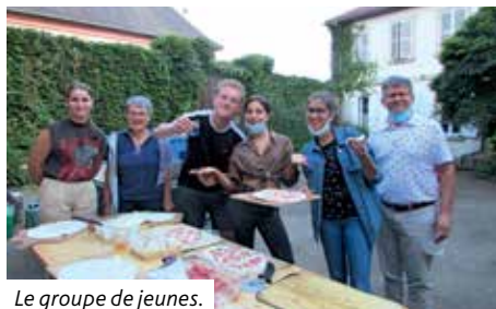
Le groupe de jeunes.