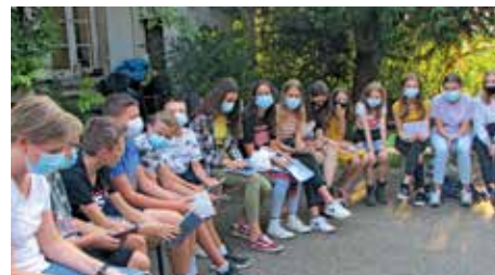
Rencontre KT du 18 septembre 2020.