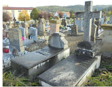
Monument funéraire au cimetière protestant de Wasselonne